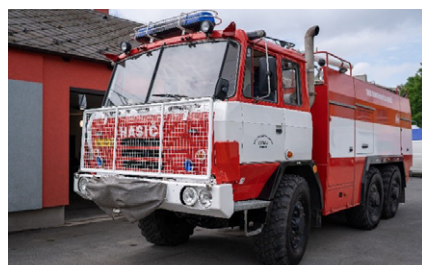
■ Soudobý hasičský vůz