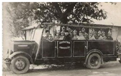
■ První hasičský vůz SDH Bartovice