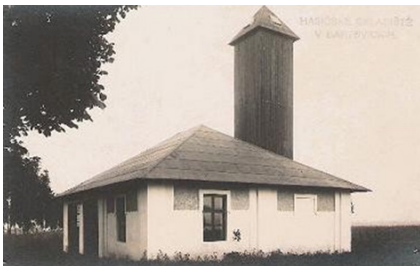
■ Původní hasičská zbrojnice

V sobotu 10. 6. proběhla oslava 100 let od založení Sboru dobrovolných hasičů v Bartovicích. Ve 13.00 hodin vyšel slavnostní průvod od Společenského domu v Bartovicích přes