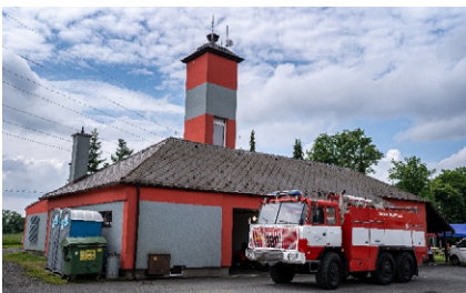
■ Hasičská zbrojnice dnes

ulice Těšínská, Za Školkou a Bartovická směrem k bartovické hasičské zbrojnici, kde následovalo přivítání zúčastněných sborů a hostů, mezi kterými byli starosta a místostarostka městského obvodu Radvanice a Bartovice, starosta Okresního sdružení hasičů Ostrava,