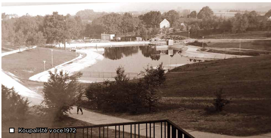
□ Koupaliště voce 1972