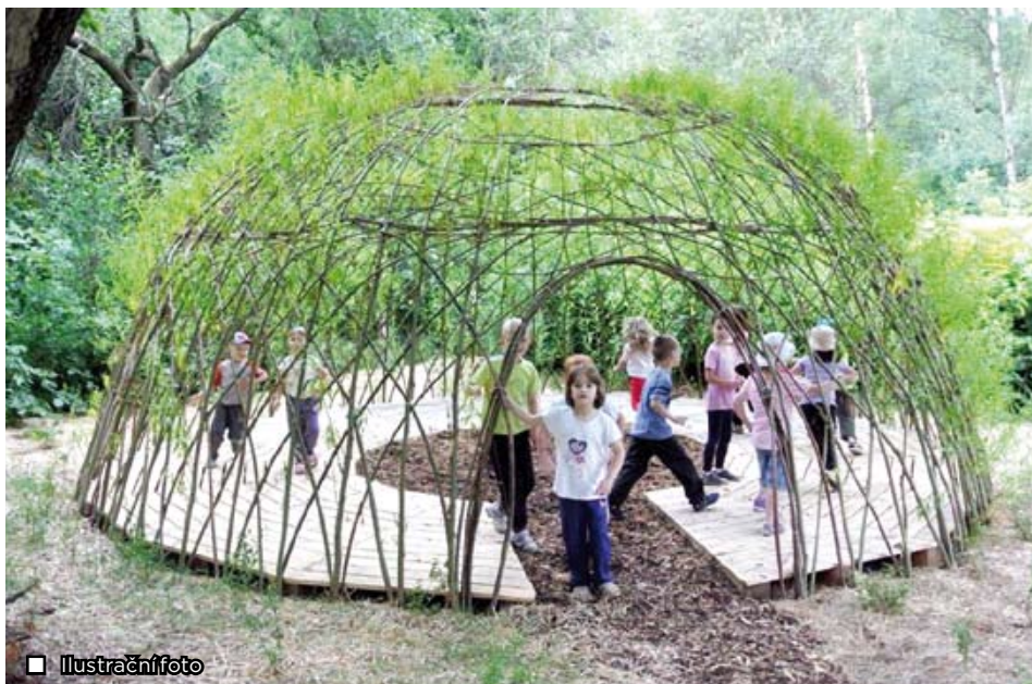
■ Ilustrační foto

Děti z mateřské školy Za Ještěrkou v Ostravě-Bartovicích se mohou těšit na zcela novou zahradu, která vznikne na rozloze cca 4 500 m 2 přilehlých nevyužitých prostor vedle stávající zahrady směrem k Podleskému potočku. Zahrada bude celá v přírodním stylu. Bude osázená kromě běžných listnatých a jehličnatých stromů také ovocnými dřevinami, jako jsou např. třešně, jabloně, hrušně, ostružinové, malinové a rybízové keře, borůvčí atd. Travnatý porost doplní květnaté louky. Nebudou chybět ani dětské herní prvky, jako jsou kladiny, lanové pavučiny, tabule k malování či tunely z vrbového proutí. K edukaci a poznávání přírody poslouží hmyzí hotel, neboť je známo, že právě malé děti rády poznávají ve svém okolí různé broučky. V nové zahradě bude vysázeno na 40 nových stromů a přes 400 keřů a záhonů s květinami. Na realizaci projektu, kterým se uvedená plocha zrevitalizuje, je potřeba 1,5 mil. Kč, avšak podstatnou část ve výši 1,2 mil. Kč obdrží náš městský obvod z fondu životního prostředí.