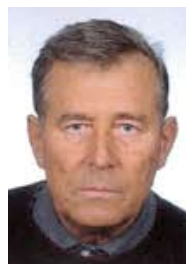
výročí úmrtí pana