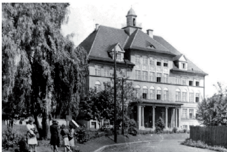
■ Budova školy na ul. Vrchlického