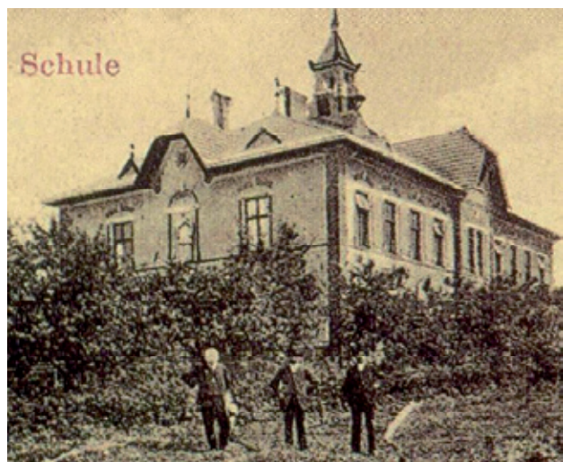
■ Budova školy na ul. Havláskova