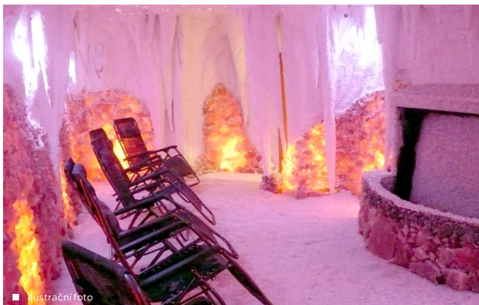
■ Ilustrační foto

Statutární město Ostrava, městský obvod Radvanice a Bartovice vlastní budovu, která svým účelem slouží ke společenskému setkávání obyvatel, a to zejména seniorů z části Radvanic. Budova pochází z 50. let minulého století a léta užívání se podepsala na špatném technickém stavu budovy. Budova má zastaralou elektroinstalaci, poškození vnitřní omítky a nevyhovující sociální zařízení. Velkou nevýhodou je rovněž chaotické uspořádání vnitřních prostorů, které svou dispozicí nevyhovují setkávání většího počtu osob. V rámci rekonstrukce bude ve