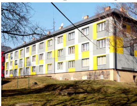
■ Bytový dům na ulici Čapkova 54, 56, 58

Pokud se vedení obvodu podaří získat potřebné finance, mělo by se ještě letos začít s rekonstrukcí bytového domu na Revírní 4 s tím, že na Ministerstvu životního prostředí leží žádost o dotaci na revitalizaci prostředí mezi všemi bytovými bloky (trávníky, chodníky apod.). V současné době se připravuje projektová dokumentace na ul. Matušinského. (red)