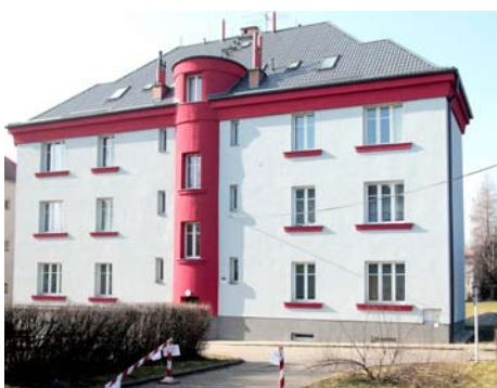
■ Bytový dům na ul. Revírní 2