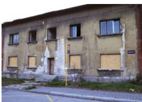
■ Zdevastované domy v lokalitě „Trnkovec“.