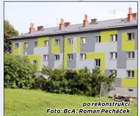
po rekonstrukci