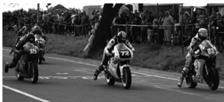
■ Start finálového závodu mistrovství ČR supermono.

Po ručně kované trofeji z Ostravy touží každý závodník, ale v náročné konkurenci na ni dosáhnou jen ti nejlepší, proto bylo po