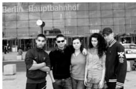
■ Společná fotografie účastníků mezinárodního festivalu

Tři naši žáci s pedagogickým doprovodem se účastnili mezinárodní mládežnické výměny pro 36 mladých Romů a ne-Romů z 6 evropských zemí (Maďarsko, Bulharsko, Španělsko, Česká republika, Slovensko, Německo). Celý program čtyř workshopů (uměleckého, divadelního, hudebního, tanečního) směřoval k nacvičení programu na romský festival Herdelezi . Naše skupinka také měla možnost si projít Berlín i účastnit se různých her na téma vzájemné poznávání účastníků i zemí, ze kterých pocházeli. Žáci se vrátili plni nadšení, s novými zážitky, se zvýšeným sebevědomím a procvičenou angličtinou v praxi. ZŠ Trnkovecká