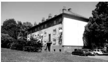
■ Současný nevyhovující stav bytového domu