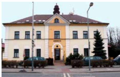
■ Radnice by se měla stát energeticky úspornou budovou.