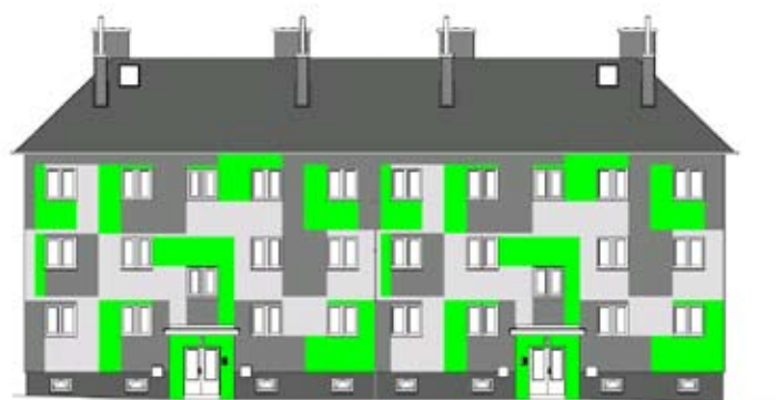
■ Takto bude vypadat bytový dům na Revírní ulici 3 a 5 v Radvanicích.