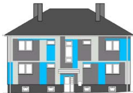
■ Nový kabát dostane i bytový dům na Třanovského ulici 29.

věnovat se různým zájmovým činnostem a účastnit se zajímavých besed na různá témata.