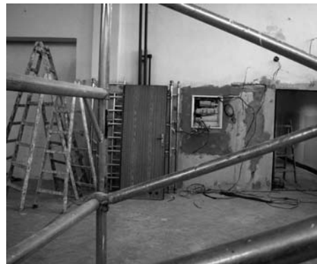
■ Takto škola vypadala v prosinci. Všichni doufali, že se oprava stihne do konce vánočních prázdnin.

Ve škole jsme začali učit hned po vánočních prázdninách, takže jak jsme na Trnkovci začali nový školní rok, končíme zde i jeho první pololetí. Také zápis do přípravy a první třídy jsme mohli organizovat už ve své, byť ještě ne plně dovybavené a vyzdobené škole. S tím se chceme vypořádat během jarních prázdnin, tak abychom mohli symbolicky otevřít nově opravenou, uklizenou a vyzdobenou školu v únoru