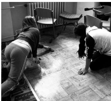
■ O vánočních prázdninách pomáhali škole rodiče i učitelé.