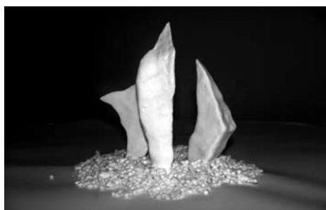
■ Na výstavě se lidé mohou podívat také na makety jednotlivých návrhů.