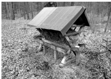
■ Jeden ze tří ukradených krmelců v roce 2011.