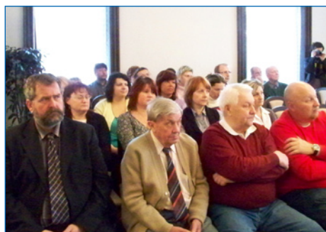
■ Pracovního setkání s ministrem se na radnici zúčastnili i obyvatelé obvodu.

V pátek 19. února navštívil náš městský obvod ministr životního prostředí JUDr. Jan Dusík, M.Sc. Na tomto pracovním setkání se setkal také s obyvateli našeho městského obvodu Radvanice a Bartovice. Ve svém vystoupení občany ujistil, že bude pokračovat tlak všech orgánů kraje a státu na firmu ArcelorMittal a další znečišťovatele ovzduší, aby se opatření vedoucí ke snížení emisí neza- stavila v polovině.