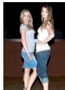
■ Madonna Fashion