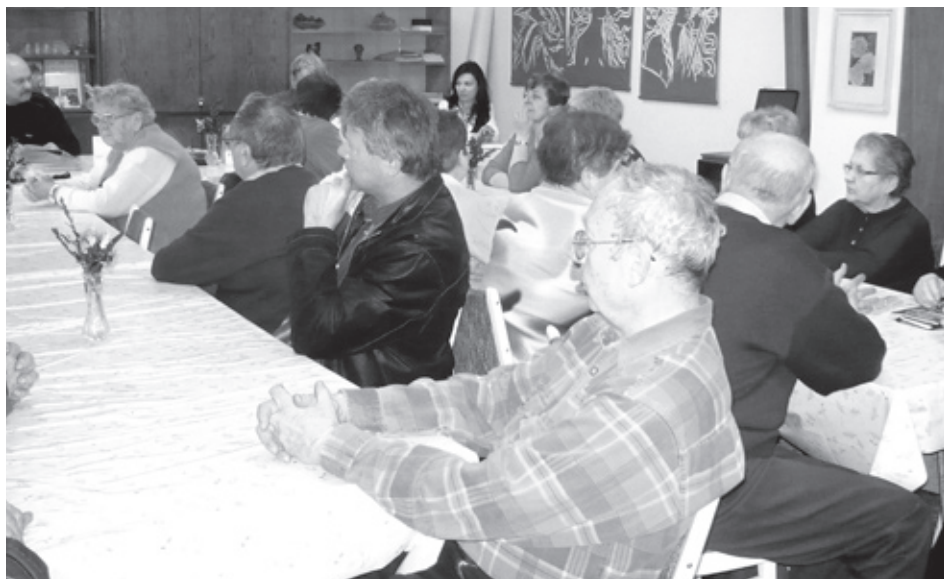
■ Neurodilo se, snad to bude tento rok lepší, věří zahrádkáři