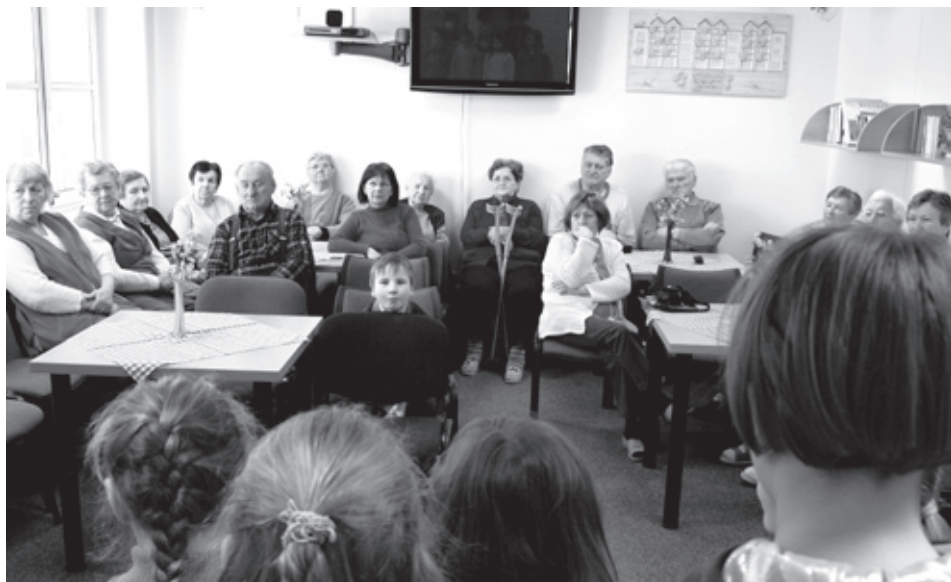
■ Oslav Mezinárodního dne žen se v Domově s pečovatelskou službou zúčastnilo hodně seniorů