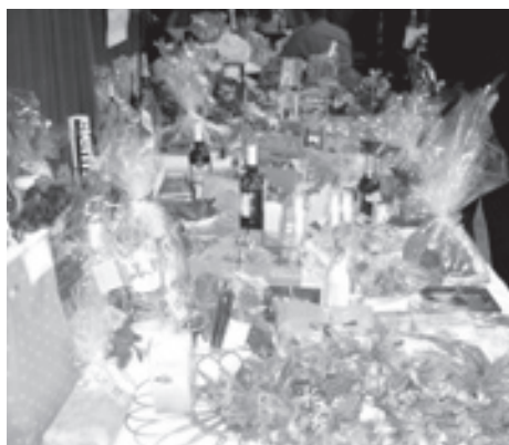
■ Lidé se při tanci dobře bavili. Plesová tombola byla velmi bohatá