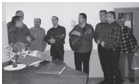
■ V souboru Pasika zpívají jen muži. Koncert si přišlo poslechnout hodně seniorů