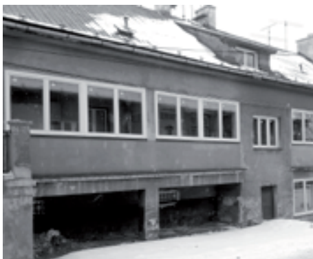
■ Fotografie vlevo ukazuje stav domu před rekonstrukcí. Vpravo po výměně oken a zasklení lodžii