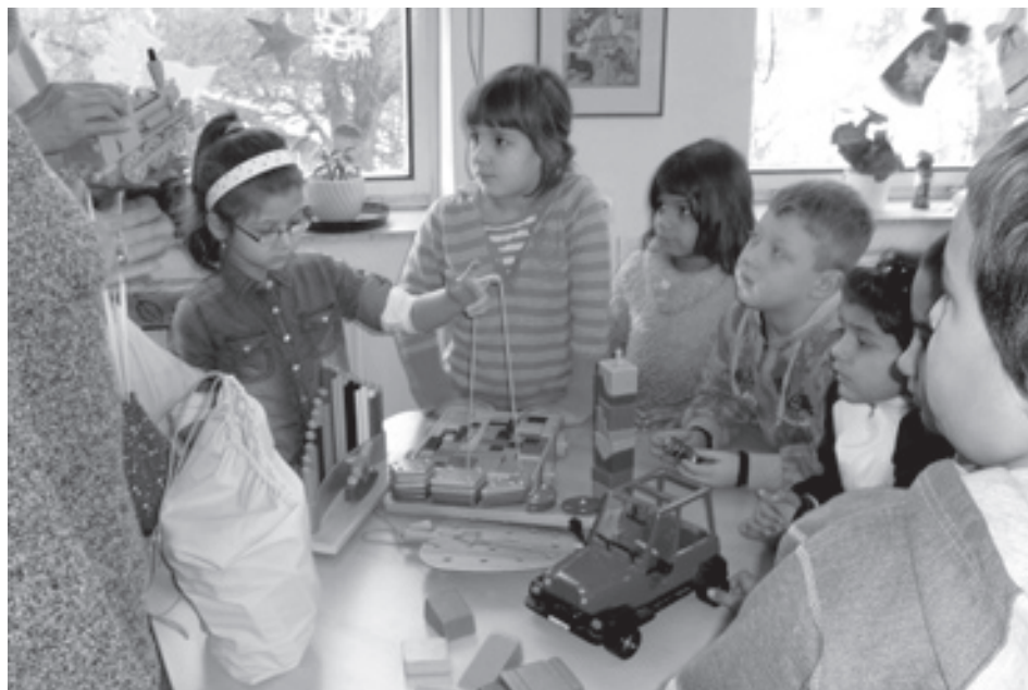
■ Hračky vyrobené vězni si děti se zájmem prohlížely