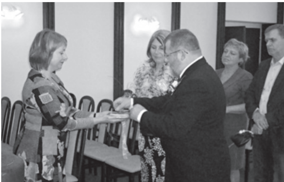
■ Šťastná chvíle pro všechny zúčastněné