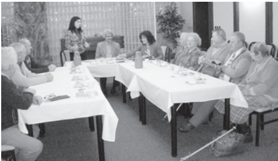
■ Poradní sbor seniorů zasedal tentokrát v obřadní síni radnice

Členové sboru se na svém jednání zajímali o vylepšení úrovně vánoční výzdoby, nedostatky zimní údržby v Radvanicích, přimlouvali se za vybudování dalších chodníků a přechodů pro chodce u Ozdravného centra Ještěrka a znovu byl projednáván stav ohledně posunu zastávky městské hromadné dopravy u ozdravného centra.